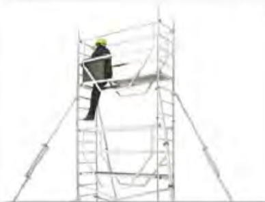
3. L'utilisateur accède au niveau supérieur en toute sécurité via la trappe du plateau supérieur. Plus besoin d'EPI pour monter l'échafaudage.