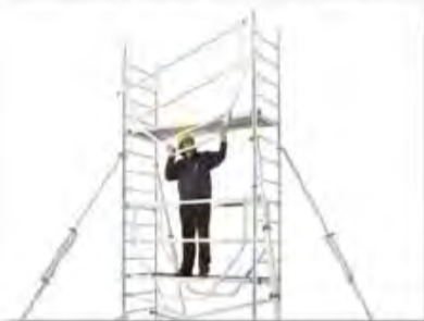
1. Le monteur fixe le garde-corps monobloc depuis le sol ou depuis un plateau inférieur déjà sécurisé.

Au montage comme au démontage, l'utilisateur est sûr d'être en toute sécurité. Grâce au garde-corps monobloc L'Echelle Européenne l'utilisateur est assuré d'une mise en sécurité rapide et simple du plateau supérieur avant de monter dessus.