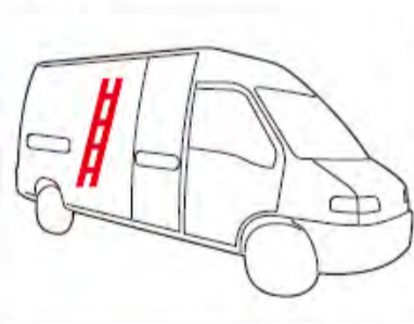
Composition spéciale grand utilitaire (LV1 dans les tableaux)