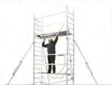
2. Rapide à mettre en place, le garde-corps pese moins de 5 kg et ne comporte que 2 points de fixation.